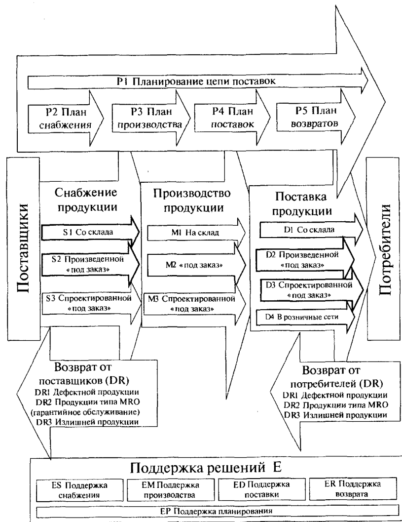
Рис. 1. Стандартные условные обозначения SCOR

Однако для успешного применения SCOR-mod необходимо комбинировать ее с другими инструментами и методологиями моделирования бизнес-процессов, достигая стратегического соответствия условиям внешней среды. Поэтому при проведении моделирования будет использован инструментарий маркетинга, стратегического менеджмента и проектирования бизнес-процессов низшего уровня с использованием методологии ARIS (architecture of integrated information systems). В ходе моделирования процессов цепи поставок и конкретной фокусной компании используется предложенный данным исследованием кросс-дисциплинарный алгоритм (рис. 2).